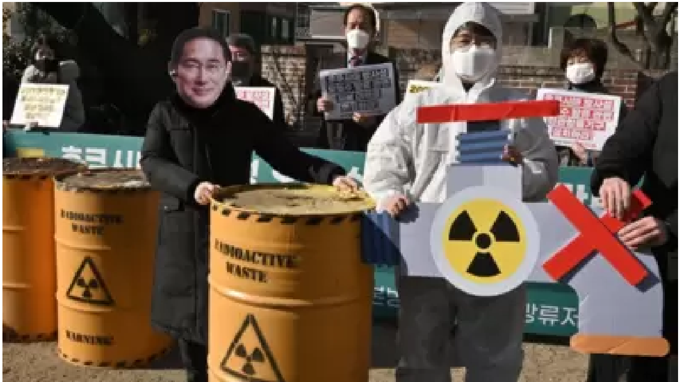
福岛核废水排海倒计时邻居反应激烈 “不仅是经济问题，还生死攸关”