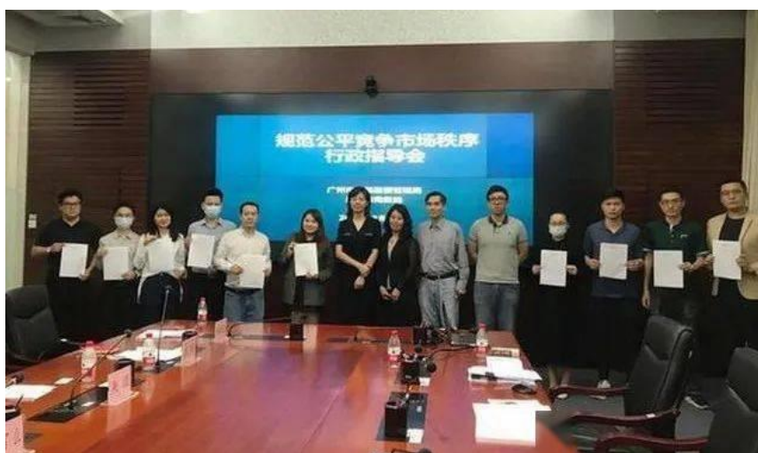
图 1：10 家互联网平台企业代表签署《平台企业维护公平竞争市场秩序承诺书》，不非法收集、使用消费者个人信息，不利用数据优势“杀熟”。[1]

相比实体的商城，京东滴滴美团等平台对每个客户的行为轨迹更是了如指掌，别说你买了什么东西，就是你盯着某个钻戒是2秒还是5秒它都知道。利用这些信息，很容易给客户分个类划个圈，好点儿的给你推荐点儿可能感兴趣的东西，糟糕的连价格都改了，直接朝着你的容忍底线要价。这就是大数据杀熟了。