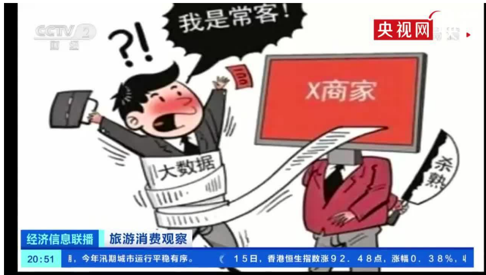
图 2：央视报导大数据杀熟

那么，大数据杀熟需要什么技术呢？讲真，实在不需要什么特别的技术，如果某位客户经常买买买，统计一下他/她来逛的频度和每次的花销就知道这是个粘着性很强的土豪了。真正需要点技术的是如何快速地把生人变成熟人，也就是练一双火眼，新客户只要一露面就知道他是不是土豪。